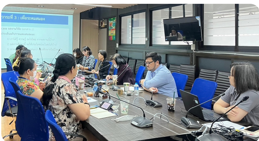
ภาพบรรยากาศการหารือใน ecosystem การสร้างวิจัย และนวัตกรรมด้าน คบส. ครั้งที่ 1